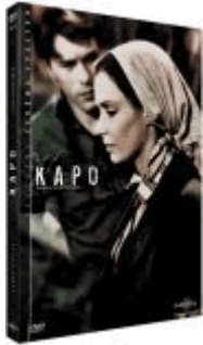
Image : Noirs profonds et magnifique gestion des contrastes pour une édition très soignée. La compression a elle le bon goût de se faire discrète. On regrettera juste un certain manque de définition et quelques scories sur le master, défauts mineurs qui ne sauraient toutefois vous freiner, d'autant qu'hormis l'Italie, la France est le seul pays au monde à proposer une édition DVD de ce film célèbre mais rare.

Son : Son clair et distinct, avec un bon équilibre musique / dialogues, que ce soit sur la version française ou la version originale. Sous titres blancs avec liseré noir.