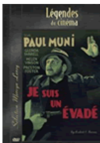
Image : Un DVD de bonne facture, surtout pour un film vieux de... 75 ans. Les contrastes sont splendides, avec des noirs profonds à souhait, et la compression sait rester discrète. On regrettera toutefois dans l'ensemble un certain manque de définition, et quelques plans abîmés, où la pellicule a subi le poids des ans. Rien de préjudiciable toutefois pour ce DVD fort honorable, absolument identique au Zone 1..

Son : Là encore, du bon travail. Le son est un peu étouffé, mais on mettra sur le compte de l'ancienneté du film ce défaut très mineur : l'ensemble reste tout à fait satisfaisant. A noter que le film n'est proposé que dans sa VOST.