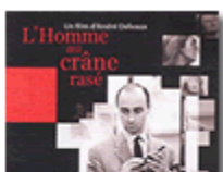
Image : A l'instar du DVD de Rendez-vous à Bray , l'édition de L'homme au crâne rasé est d'une qualité exceptionnelle. Le master, parfait en tous points et d'une propreté éclatante, est servi par une numérisation aux contrastes soignés et à la compression discrète. Offert en 16/9, ce film rare trouve ici un écran digne de sa renommée, grâce au travail de restauration de la Cinémathèque Royale de Belgique et au courage éditorial de La Vie est Belle, qui ose aujourd'hui sortir le film dans